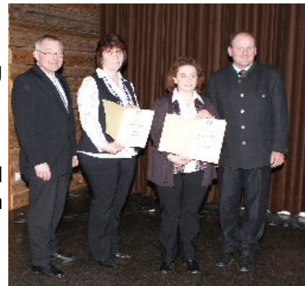
Gesangs- und Musikverein